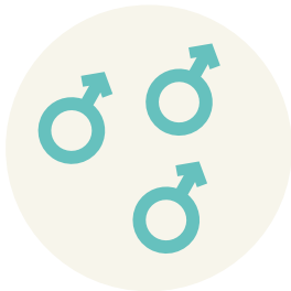
Groep van enkel mannetjes